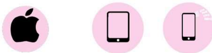
Image 4 : Présentation de l'application Zoom Cloud Meetings dans l'App Store.

Téléchargez Zoom Cloud Meetings dans l'App Store à partir de ce lien.