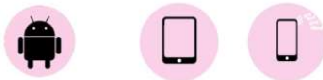
Image 3 : Présentation de l'application Zoom Cloud Meetings dans Google Play.