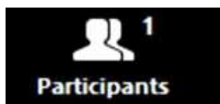
Image 12 : Visuel du symbole qui ouvre la fenêtre des participants.

Une fenêtre s'ouvrira à droite de l'écran, souvent dans la même section que le clavardage. Vous y retrouverez la liste des personnes participant à la webdiffusion.