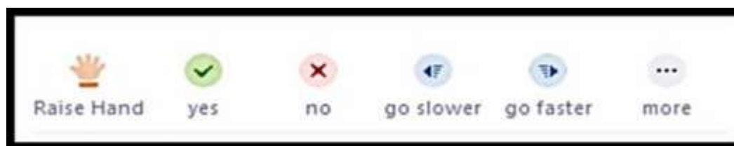
Image 11 : Icônes indiquant les options de communication non verbale.

Pour y accéder, cliquez sur le symbole « Participants » représentant des personnages. Ce symbole est situé dans la barre en bas de la fenêtre de Zoom.