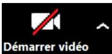
Image 6 : Symbole affiché lorsque votre caméra est désactivée.

Lorsque votre caméra n'est pas activée, le symbole est barré d'un trait rouge et il est écrit en dessous « Démarrer la vidéo ».