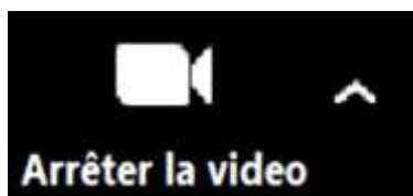
Image 5 : Symbole affiché lorsque votre caméra est activée.

Lorsque votre caméra n'est pas activée, le symbole est barré d'un trait rouge et il est écrit en dessous « Démarrer la vidéo ».